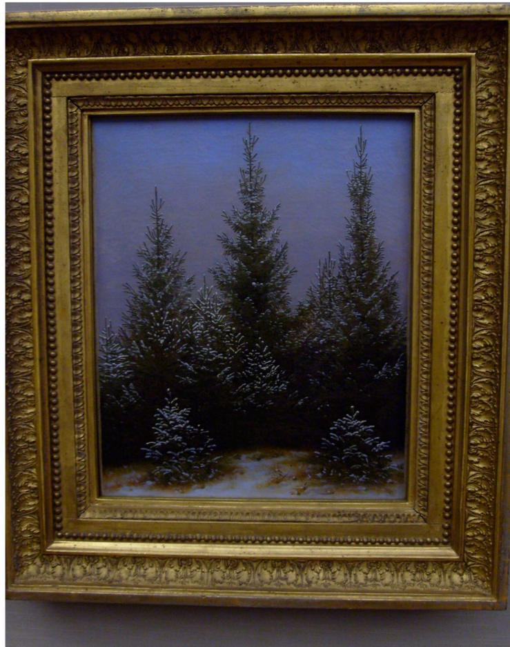
Pittura in Germania nel XIX secolo