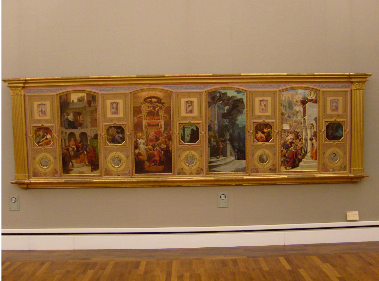
Moritz von Schwind 1804–1871 Das Märchen vom Aschenbrödel 1854 The Fairy-Tale of Cinderella 1854 Leihgabe der Bundesrepublik Deutschland | Inv. Nr. L 841